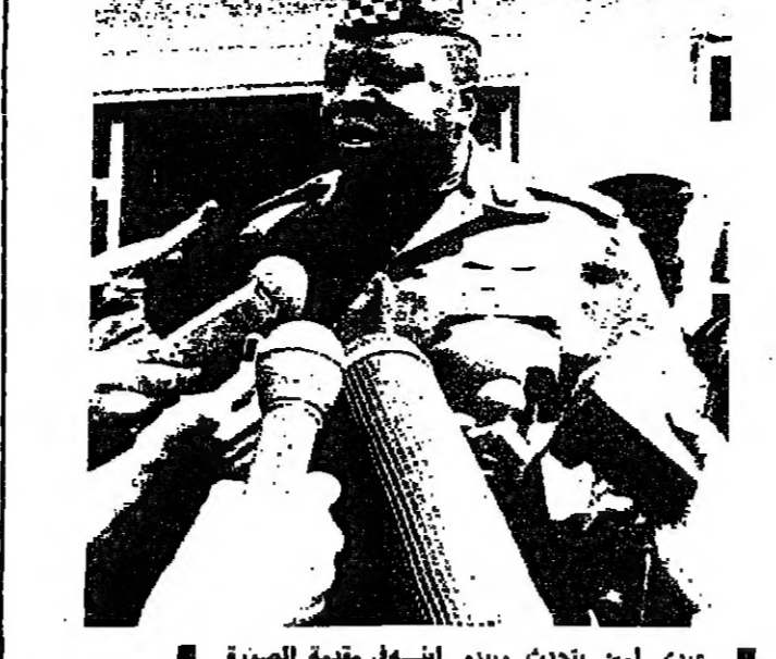
عديدي امين يتحدث ويبدو ايسه في مقبلة الصورة

كريستينا اونايسيس، ابنة اسطورة الملاحة ارسطو اونايسيس، تزوجت في السابعة والتفص مساهمات الكسندر انديديس في اثينا. اشيئة العروس، كانت مهنيا اريثميتس غاروفاليديس، وقد صرحت قائلة: انني اعتبر نفسي امها، واخاها، ووالدها وعمتها. في المستقبل ستكون عرابة اطفالها، بعد ان تست بدور الابيئة. وكان زواج كريستينا من انديديس، البالغ من العمر ٣٢ سنة، واين احد اصحاب الاملاك اليونانيين الماهلين في ملكية السفن، والمصارف، قد كان مفاجئة كبيرة لماليتها. وقالت عمه كريستينا، والعموم شهير من بينها: كان كل شيء كالظم، حصل خسارة. كريستينا سعيدة جدا، لانها وجدت للمرة الاولى في حياتها، الشخص الذي يحبها. لقد اخذنا الفخاذا، كل شيء يجسب ان ينهي خلال ٢٤ ساعة. وقد انشر الحجاب في الاسواق والحلات لشراء حاجيات العرس. كريستينا (٢٤ سنة) تزوجت الكسندر في كنيسة كاثوليكية هينوس الصغيرة. وفي الفيلد الكبرية التي تقع في ضواحي غليفاس والتي اياها كريستينا، تجمع اقرباء العروسين واصحابهم للاحتفال بزواج العروسين.